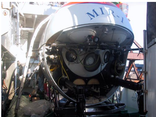
Prüfung der mechanischen und elektrischen Anlagen des Tauchbootes MIR-1 vor dem Zuwasserlassen