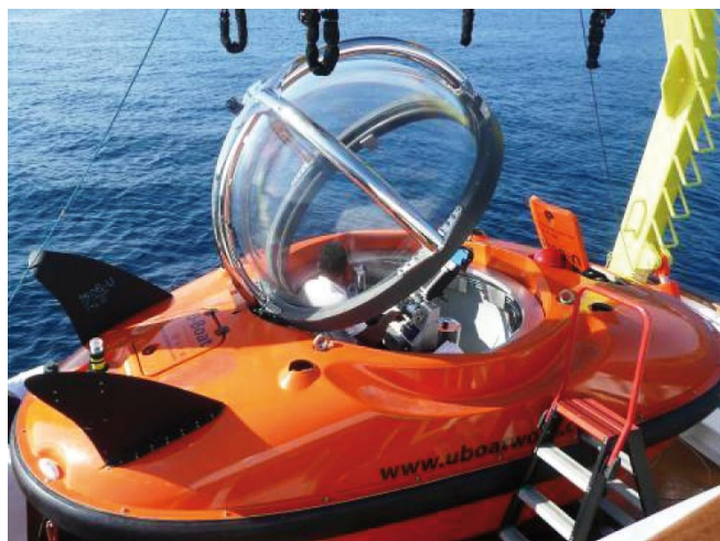
„U-Boat Worx - CQ3.1“, maximale Tauchtiefe 100 msw