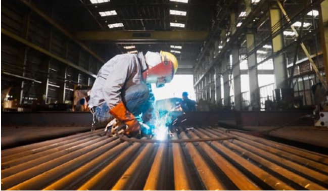
Schweißzertifizierungen – der Schlüssel zu Aufträgen von Schweißarbeiten

Warum sollten Sie den GL mit der Betriebszulassung zum Schweißen beauftragen? Der GL verfügt über mehr als 140 Jahre Erfahrung auf den Gebieten Zertifizierung und Sicherheitsdienstleistungen für den Schiffbau sowie über ein technisches Fachwissen, das seinesgleichen sucht. Darüber hinaus erleichtert der schnelle und freundliche Service weltweit das Zulassungsverfahren.