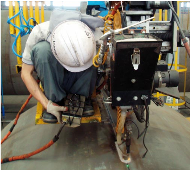
DIN 18800-7 – der Schlüssel zu Aufträgen, die komplexe Schweißarbeiten erfordern, wie z.B. das Lichtbogenschweißen von Stützpfälern von Windkraftanlagen