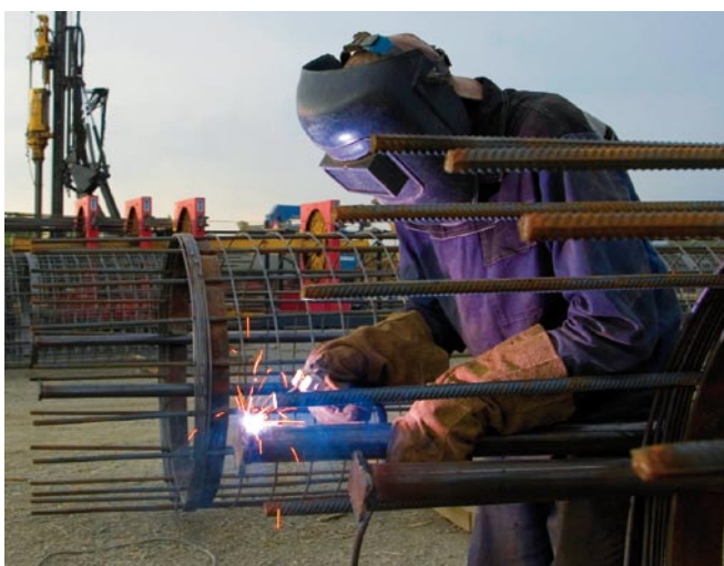
Zertifizierte Qualität durch den GL: auch für das Schweißen von Betonstahl

Woher wissen Kunden aus dem privaten oder öffentlichen Bereich, dass Ihre schweißtechnische Fertigungsstätte höchsten Qualitätsansprüchen genügt? Eine Zertifizierung nach DIN 18800-7 gibt Kunden die gesuchte Sicherheit. So müssen deutsche Hersteller von Schweißprodukten, die die öffentliche Sicherheit und Ordnung oder insbesondere Gesundheit und Leben von Menschen gefährden, gesetzlich vorgeschrieben nach DIN 18800-7 zertifiziert sein, wenn ihre Bauprodukte verwendet werden sollen. Mit anderen Worten: Die Zertifizierung ist gut für Ihr Geschäft – jetzt und in der Zukunft.