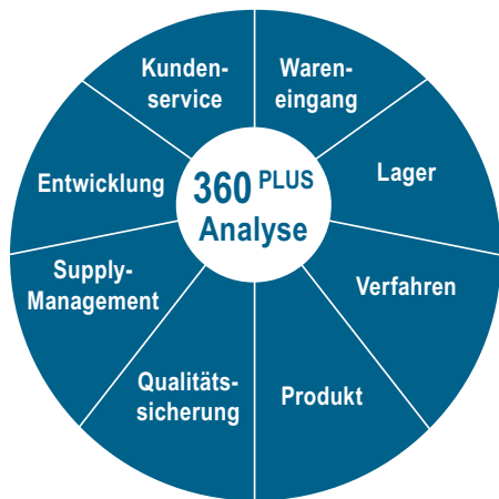
Abb. 2: im Rahmen der 360 PLUS Analyse berücksichtigte Punkte

Die vollständigen Anforderungen für die Durchführung der APZ können von unserer Website unter „Rules & Guidelines“ heruntergeladen werden.