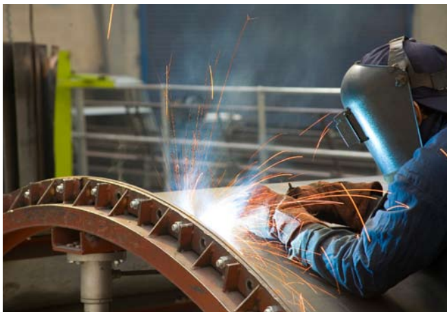
Vom GL zertifizierte Schweißbetriebe: ein Qualitätssiegel in der Schweißtechnologie